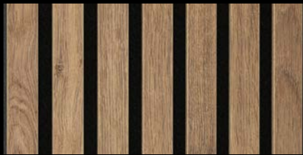
Eiche terrabraun 07031 / Holznachbildung