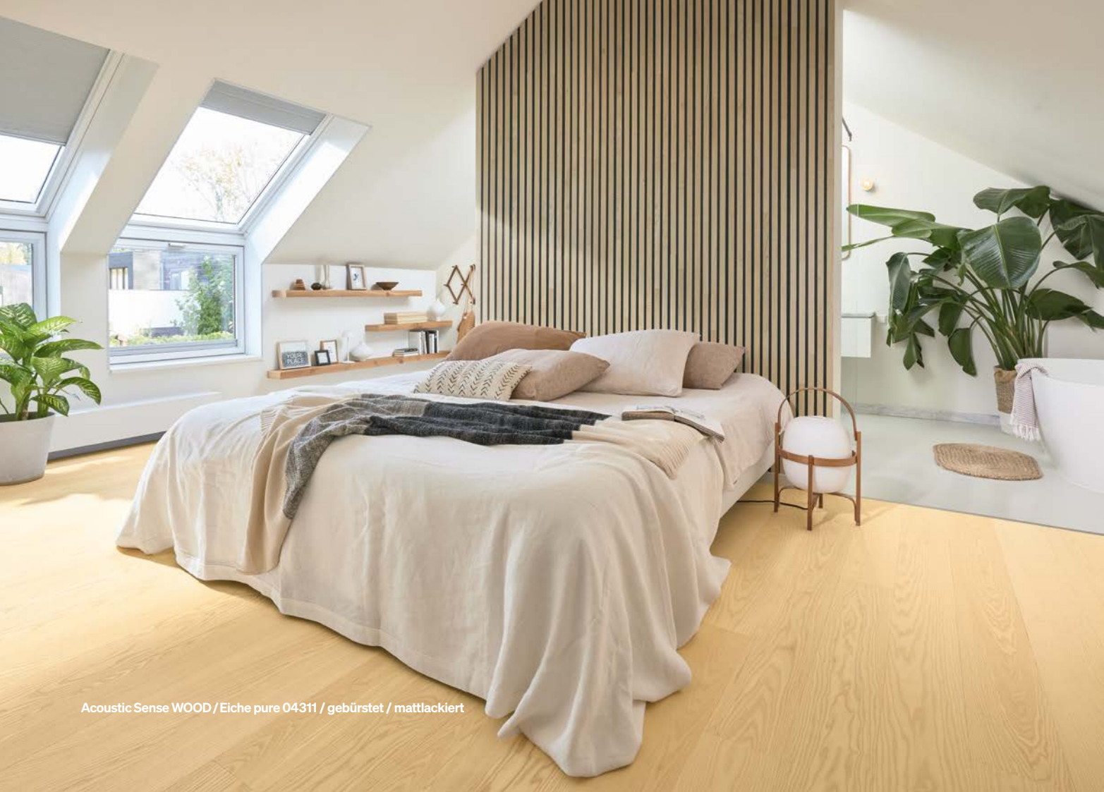
Acoustic Sense WOOD / Eiche pure 04311 / gebürstet / mattlackiert