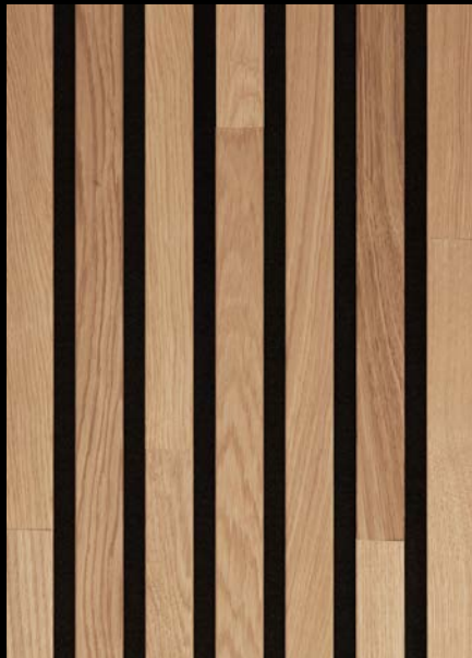
Eiche pure 04311 / gebürstet / mattlackiert