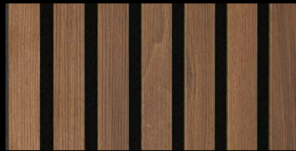
Nussbaum 07034 / Holznachbildung