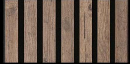
Altholzleiche 07032 / Holznachbildung