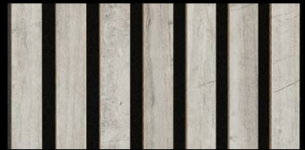
Gravel Stone 07035 / Dekor