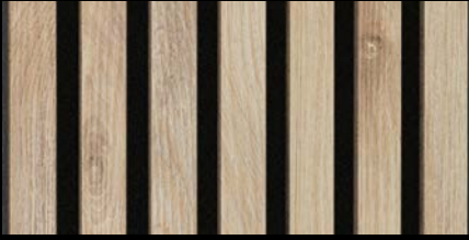
Eiche hell 07030 / Holznachbildung