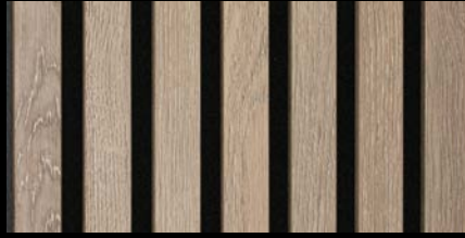
Eiche multicolor 07033 / Holznachbildung