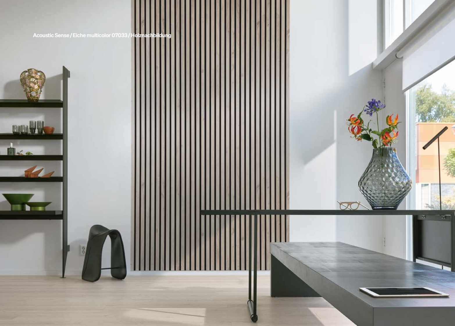
Acoustic Sense / Eiche multicolor 07033 / Holznachbildung