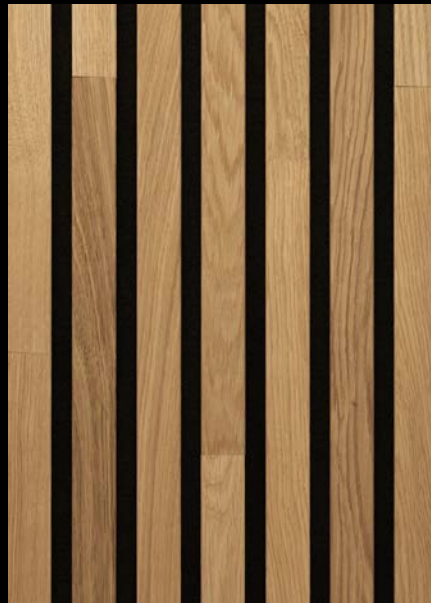
Eiche natur 04310 / gebürstet / mattlackiert