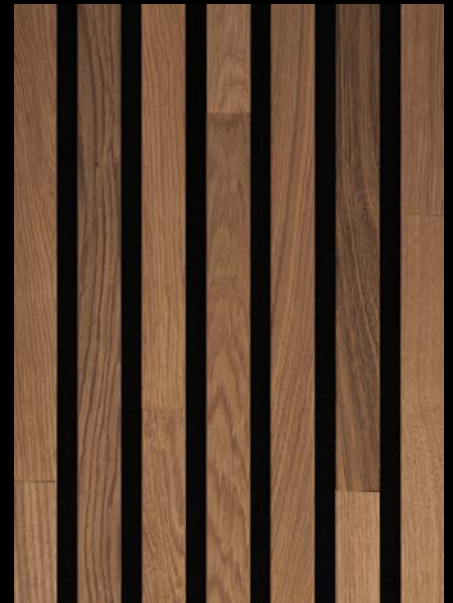
Eiche braun 04312 / gebürstet / mattlackiert